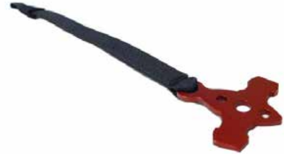
Neues KIT „anti-oublie“