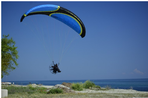
Spaß haben ;-)