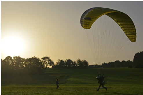
sicher Starten trainieren

Dieses Jahr starten wir eine Motorschirmtour, Motorschirmreise oder einfach Refresherkurs. Termin ist vom 30. April – 5. Mai 2023 und unser erstes Ziel ist Meduno und von dort aus ans Meer. Teilnehmerzahl max. 6 Personen Ziel der Tour: Ein Fliegerurlaub SPASS haben!!!, aber auch als Refresher, Wiedereinstieg und v.a. betreutes Fliegen gedacht.